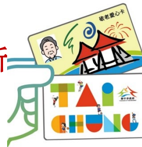
敬老愛心卡、台中市兒童卡 搭捷運享 5 折