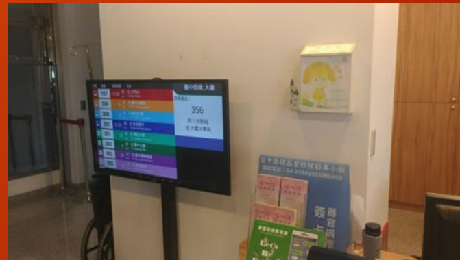
協調醫院內放置智慧型站牌資訊 圖為臺中榮總