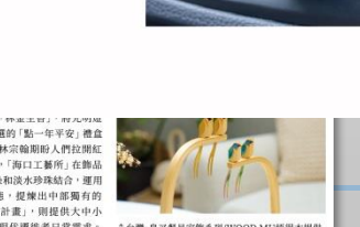
↑台灣·鳥又翼家具師系列

北極熊、北極熊、北極熊... 台中原創城市品牌獲選商品展售活動，將於8月20日至28日在臺中大遠百北棟8樓展售。現場將有33組優質文創商品，包括木器、陶瓷、文具、服飾等，展現台中在地文化創意。活動期間還將有現場派送活動，數量有限，送完為止。歡迎民眾前往參觀選購，支持在地原創產業。