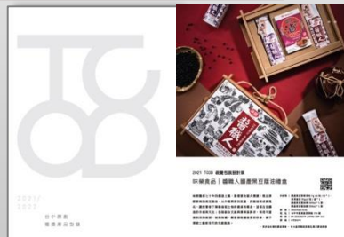
商品型錄推廣+企業採購