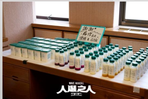
新聞局-媒合影視道具或品牌贊助