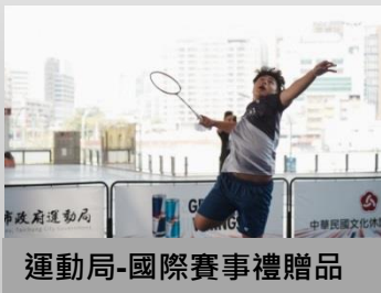
運動局-國際賽事禮贈品