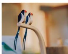
↑台灣·鳥又翼家具師系列

今日頒獎典禮由飛影舞團帶來精彩的開場演出，文化局表示，市府從去年開始推動「TCOD 台中原創」城市品牌家學者組成評審團，今年有100家業者、158組產品報名，