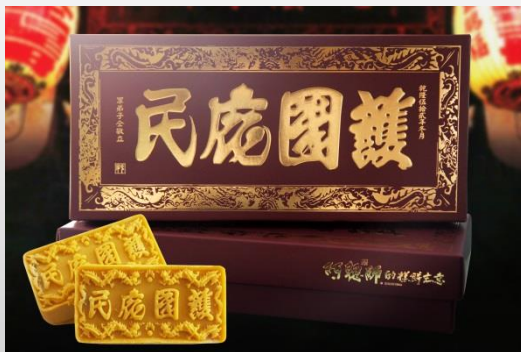
視覺及包裝設計類