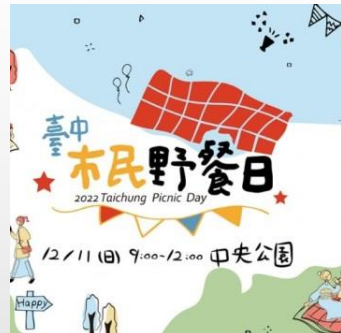
建設局-秋季野餐日設 TCOD專區推廣