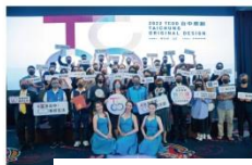
↑2022 台中原創城市品牌獲選商品