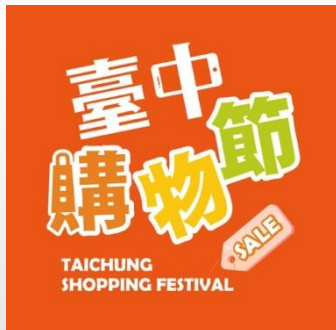
經發局-台中購物節網站 規劃TCOD專區