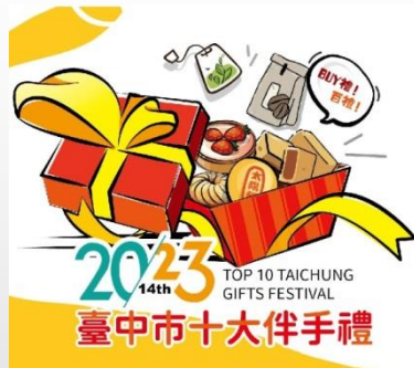
工策會-鼓勵參與十大伴手 禮徵選