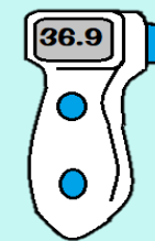
臺中市南陽國小體溫量測流程

5 國、高中於 開學日之上午 ，自行安排課程時間，運用本局製作之衛教簡報及衛生局衛教影片(我的保健室)，進行 衛教宣導 。