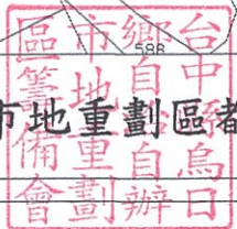
台中縣烏日鄉自治自辦市地重劃區都市計畫地籍套繪圖