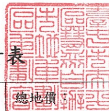
臺中市太平區慧眾自辦市地重劃區計算負擔總計表