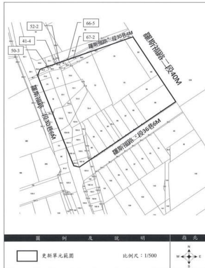
圖 2-3 權利變換地區範圍地籍套繪圖